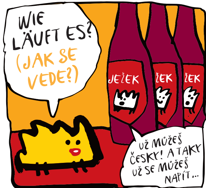
PIVOVAR JIHLAVA SE V ROCE 1998 DOSTAL ZPĚT DO ČESKÝCH RUKOU.