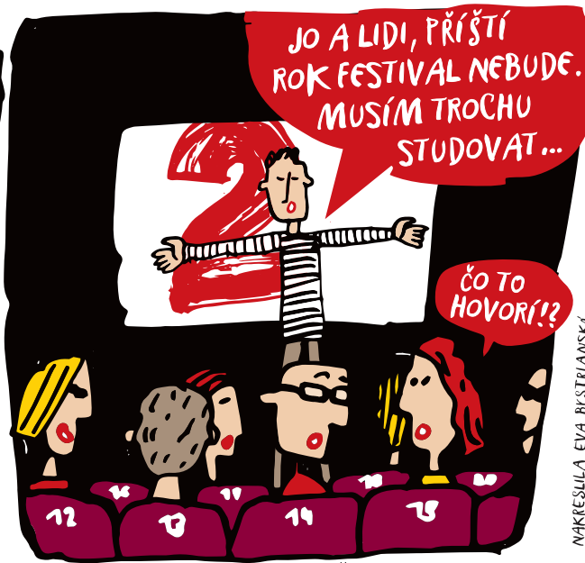
FESTIVAL SE KONAL I POTŘETÍ. A KONÁ SE KAŽDOROČNĚ DODNES. KONEC ŘÍJNA PATŘÍ V JIHLAVĚ FILMAŘŮM A DOKUMENTŮM!