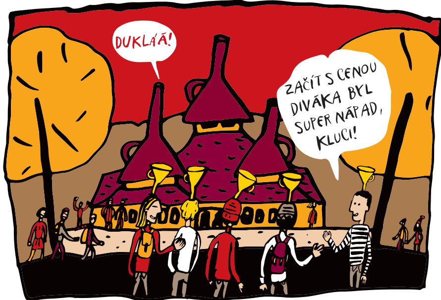
BYLO JICH PĚT STUDENTŮ GYMNÁZIA... ZALOŽILI FESTIVAL DOKUMENTŮ. V ROCE 1998 SE KONAL DRUHÝ ROČNÍK. TO UŽ JE TRADICE!