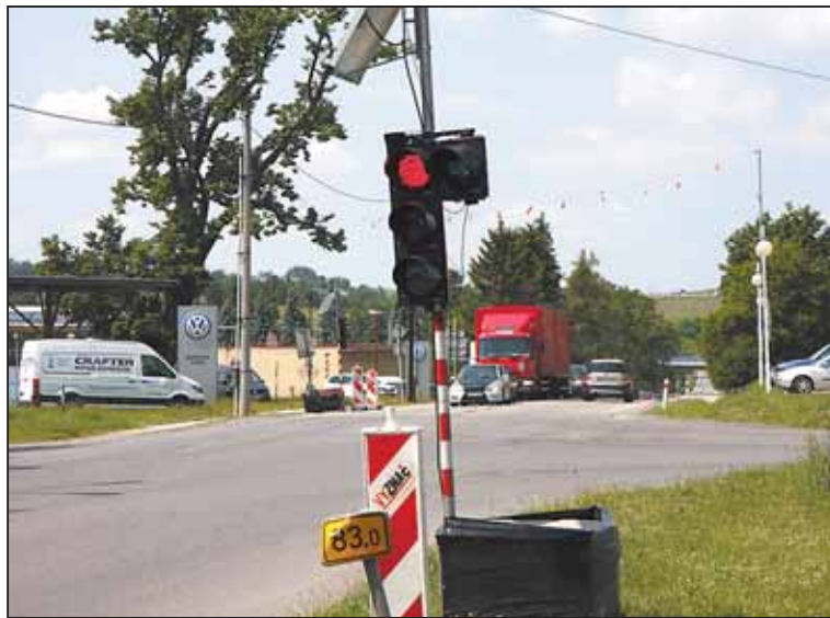
PŘENOSNÁ světelná dopravní signalizace má pomoci k plynulosti provozu u benzínky ONO.

„Umístění dočasných semaforů je řešením do doby, kdy nainstalujeme stabilní světelné řízení křižovatky. To bude součástí celkové úpravy této křižovatky, práce začnou v podzimních měsících tohoto roku,“ dodal Vratislav Výborný.