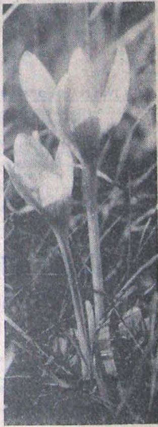
Přichází podzim... A každý, kdo si vyjde do okolí Jihlavy, může vidět v překrásné přírodě i květy ocunů, které zde vzácně roste.

Program dnešního jednání rady MěstNV Jihlava je zdánlivě nesnadný, ale jedno má společné: řeší palčivé otázky občanů okresního města. Mezi předními patří problémy související se zásobováním města palivem. Mimo toho bude rada jednat o situaci v předškolní výchově a umístění dětí do jeslí a mateřských škol a o situaci na úseku základních devítiletých škol.